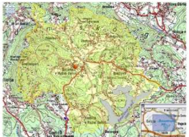
Okoliš podružnične šole Šmartno v Rožni dolini