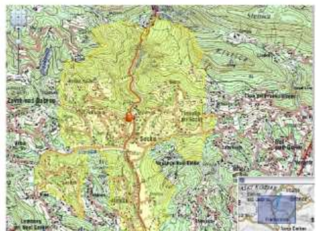
Okoliš podružnične šole Socka