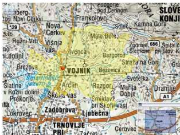
Okoliš matične šole Vojnik