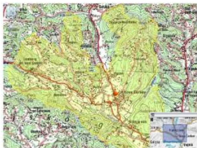
Okoliš podružnične šole Nova Cerkev