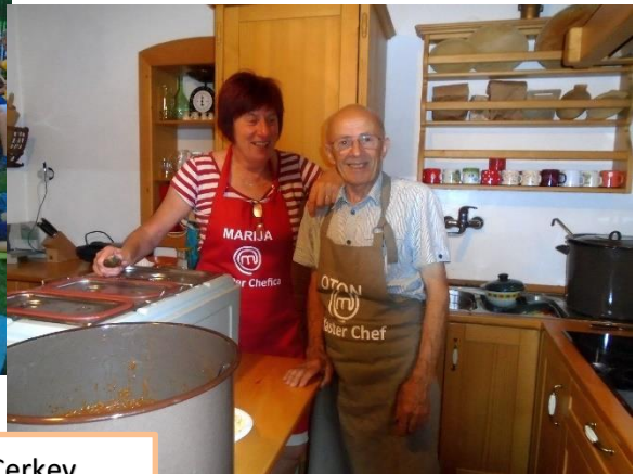
Tekma med OŠ Dobrna in OŠ Vojnik – POŠ Nova Cerkev